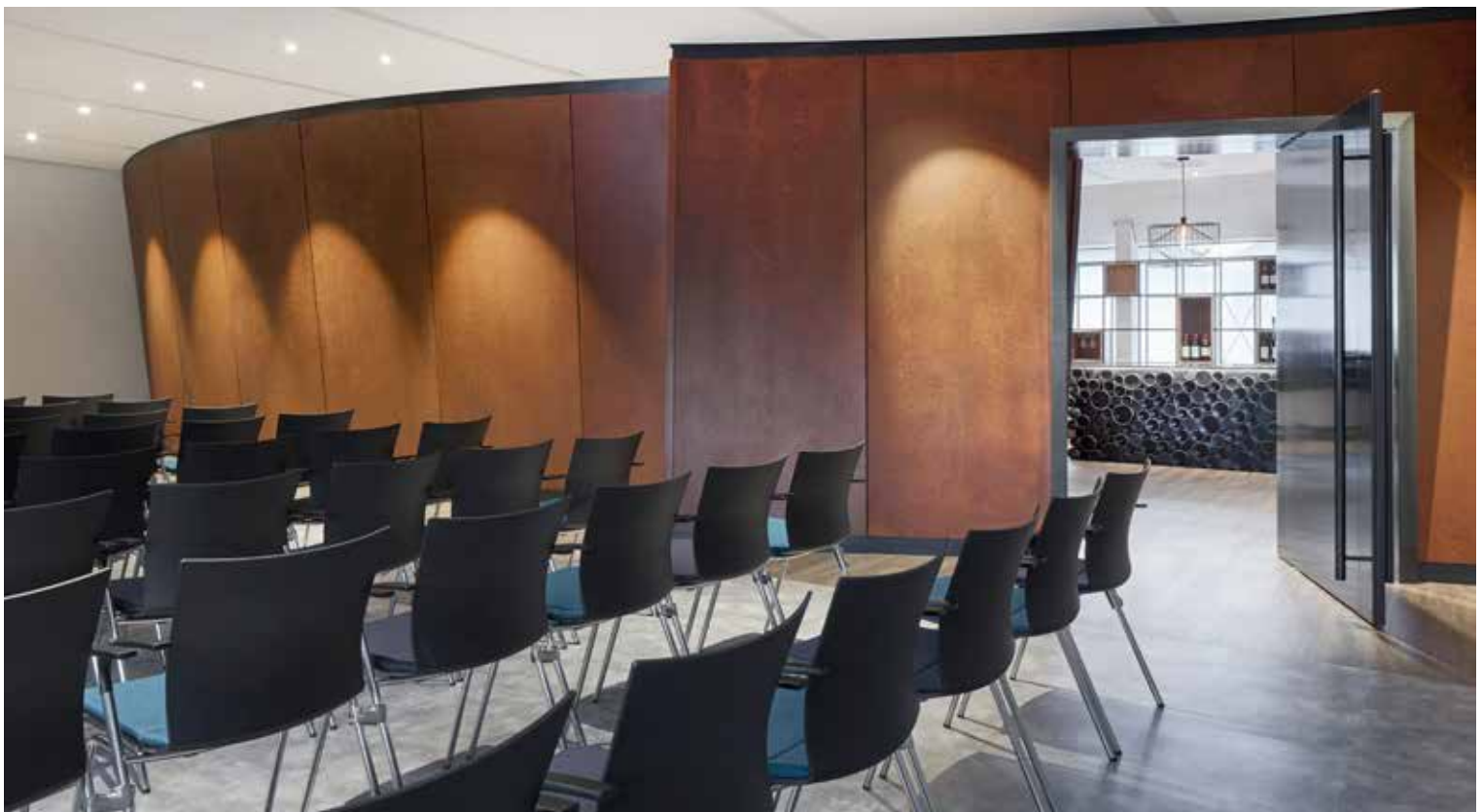
FOTO ONDER Interieur van een van de presentatieruimten.

FOTO BOVEN De bar met stalen kokerprofielen.