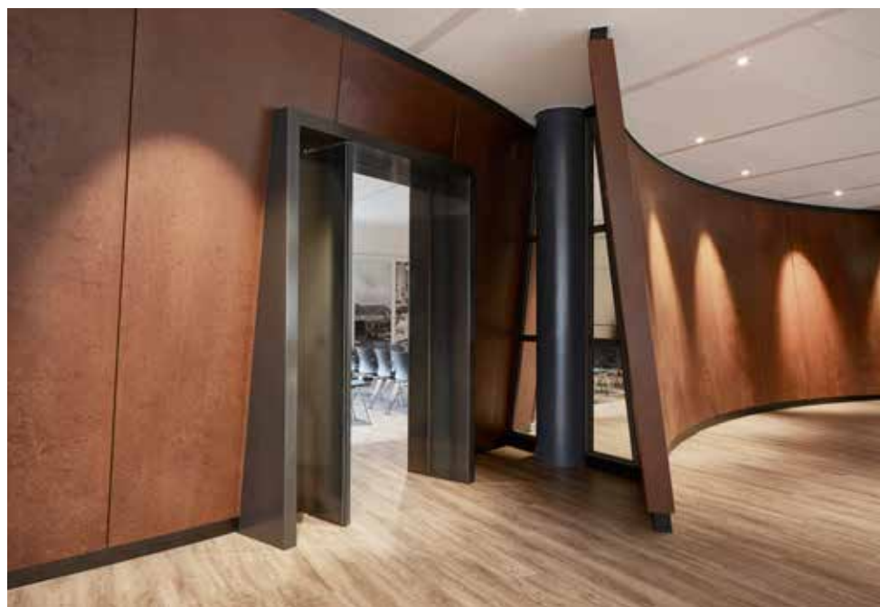
FOTO ONDER De vensters bij de kolommen geven mooie onverwachte doorkijkjes.

FOTO BOVEN De wand van Cortenstaal geeft richting aan de ruimte.